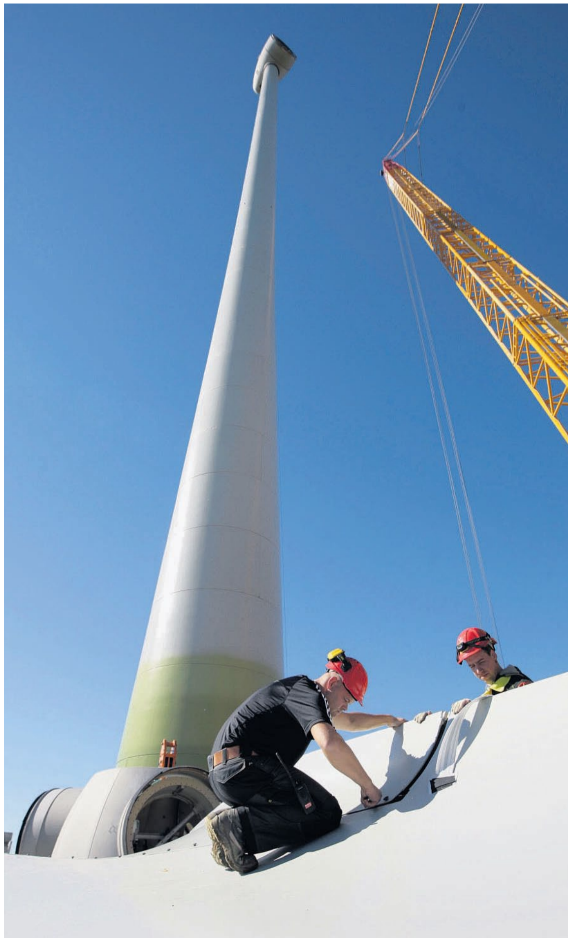
Montage von Windgeneratoren in Le Peuchapatte JU: Konzerne rechnen mit Renditen von bis zu 20 Prozent.