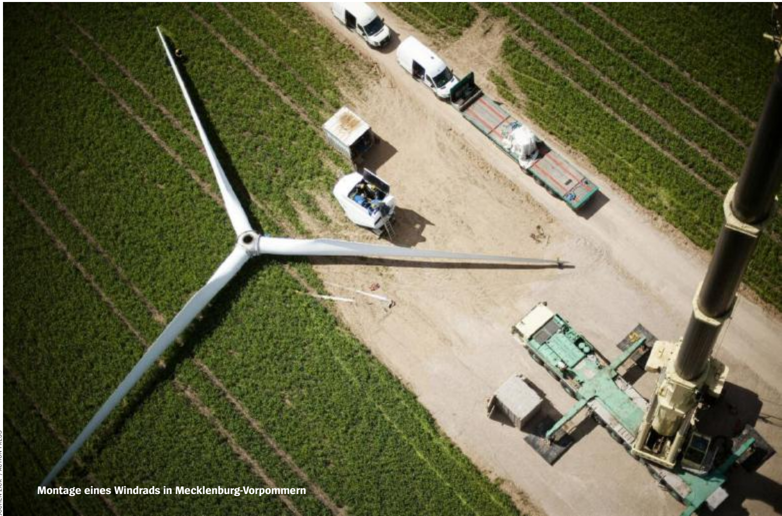
Montage eines Windrads in Mecklenburg-Vorpommern