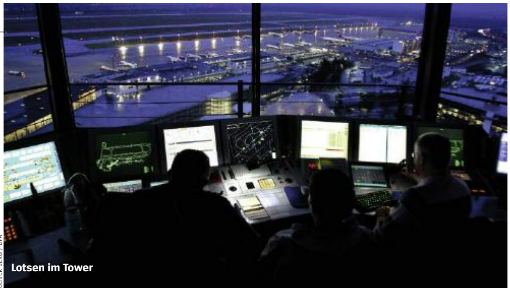
Lotsen im Tower

GUNTHER LATSCH, ANNE SEITH, GERALD TRAUFFETTER