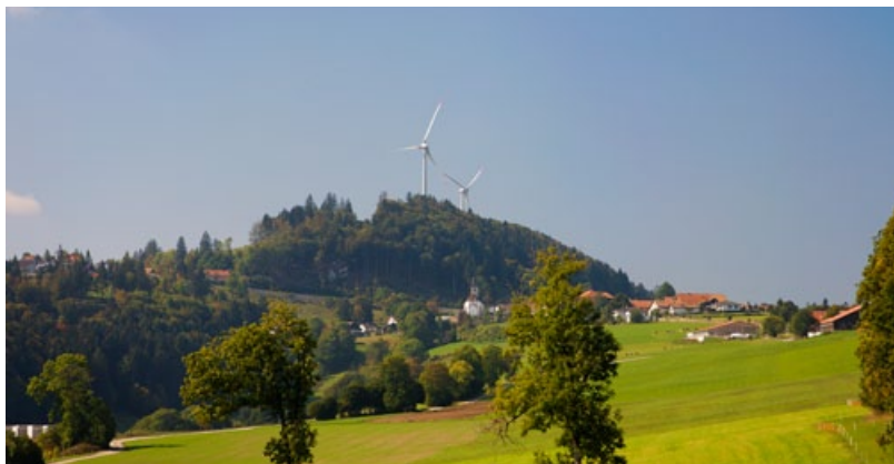
8% der Jurassier sind für Windkraftnutzung