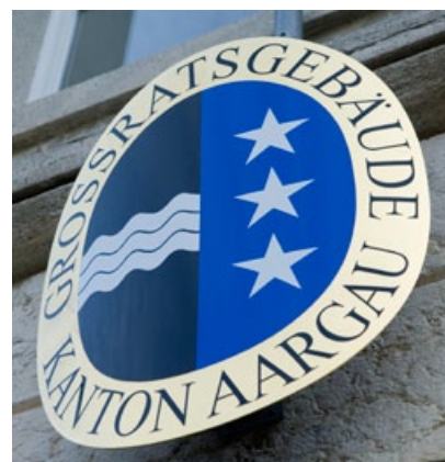
Grosser Rat gibt grünes Licht