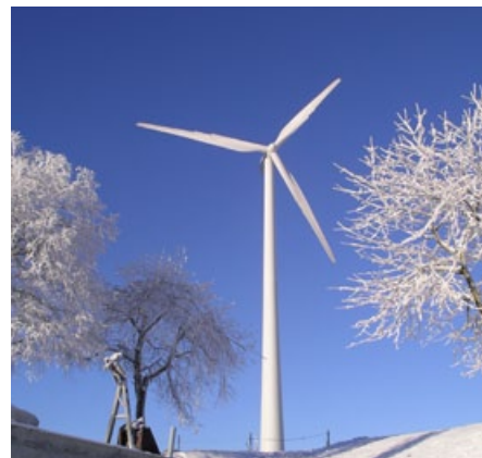
Entlebucher Anlage bekommt Schwester