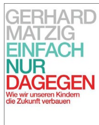
Neue Publikationen des BWE