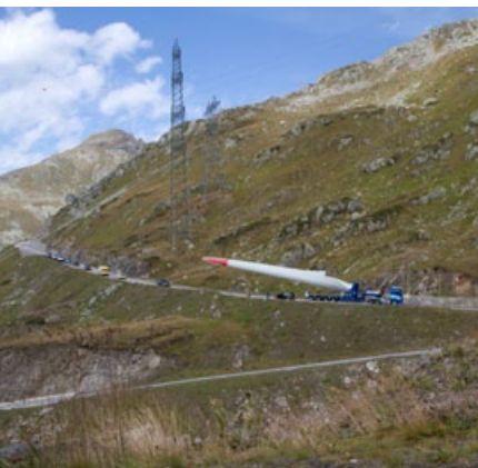
Windflügeladapter im Einsatz