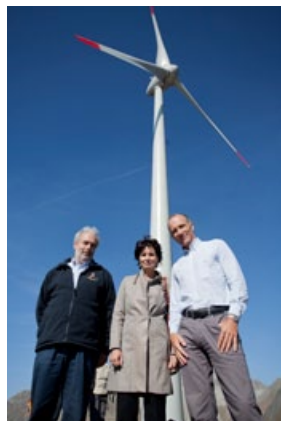
Griespass: Richtfest mit Prominenz